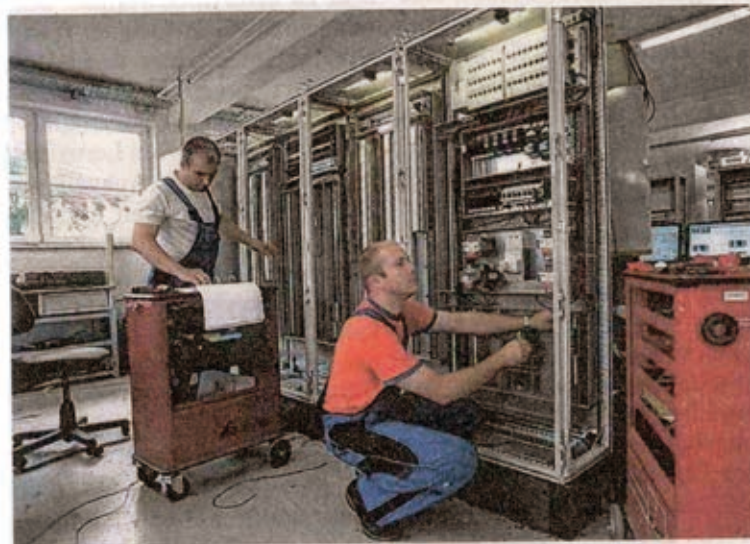
Ein Managementsystem prüft und optimiert alle Arbeitsabläufe.